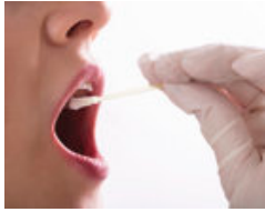
Abnahme der Speichelprobe